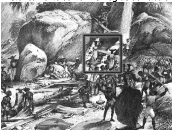
(Fonte: Lavagem do Minério do Ouro, perto do morro do Itacolomi, RUGENDAS, J. M., 1835)

23) O quadro em destaque na imagem abaixo representa uma cena do que conhecemos historicamente como “As Negras do Tabuleiro”.